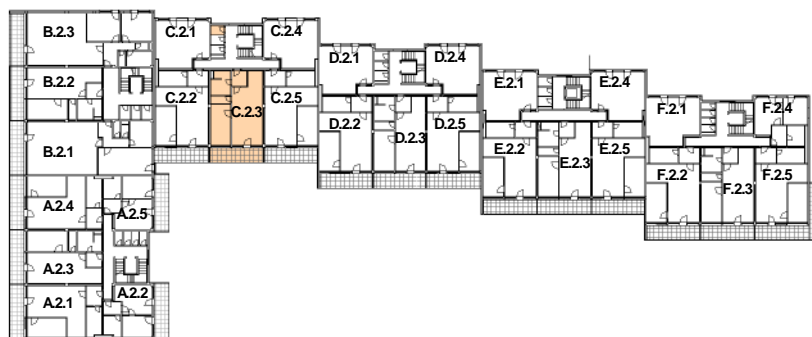
SCHÉMA DOMU - P DORYS 2NP