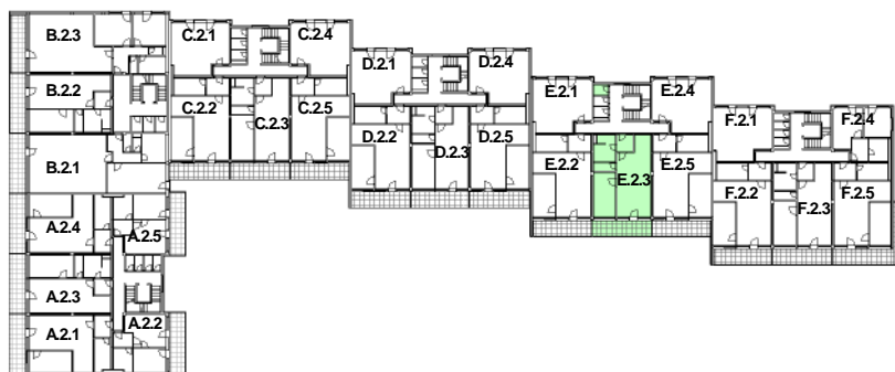
SCHÉMA DOMU - P DORYS 2NP