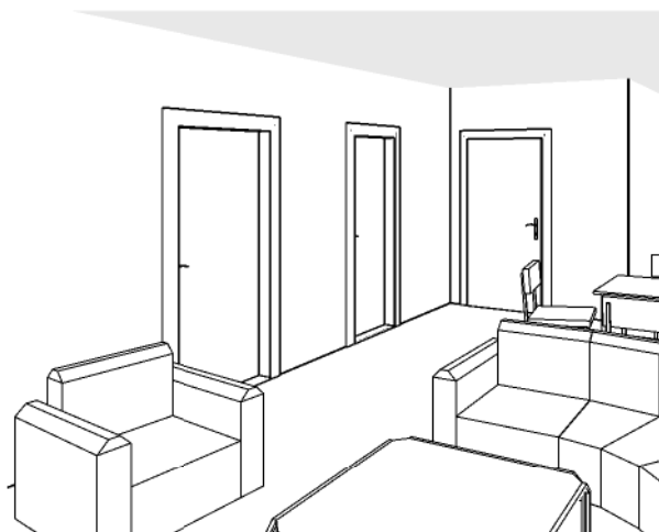
SCHÉMA DOMU - P DORYS 3NP